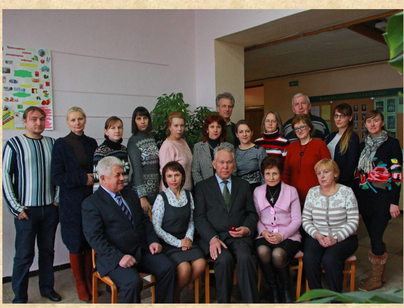
Составители С.М. Ленивко, Н.Ф. Ковалевич