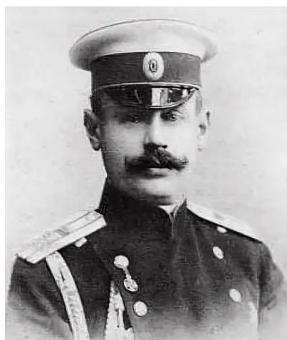
Владимир Николаевич Воейков

Русский военачальник, генерал-майор. Деятель российского спортивного движения - почётный председатель первого Российского олимпийского комитета.