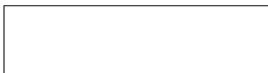
Рисунок 1 – Текст

Текст. Текст. Текст. Текст. Текст. Текст. Текст. Текст. Текст. Текст. Текст. Текст. Текст. Текст. Текст. Текст. Текст. Текст. Текст. Текст. Текст. Текст. Текст. Текст. Текст. Текст. Текст. Текст. Текст.