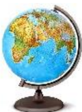
Рисунок 1 – Название рисунка (интервал перед и после 12 pt)

Текст текст текст текст текст текст текст текст текст текст текст текст текст текст текст текст текст текст текст текст текст текст текст текст текст текст текст текст текст текст текст текст.