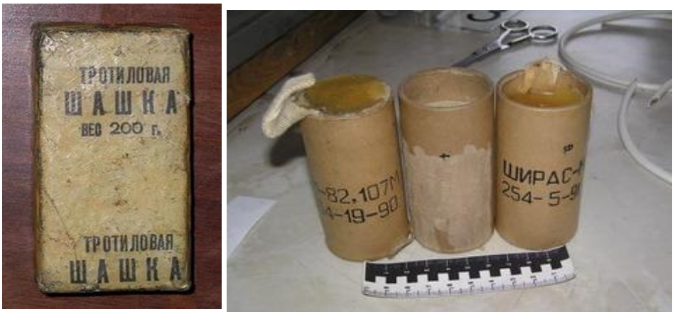
Рис.1 – внешний вид взрывчатых веществ военного инженерного назначения:

Боеприпасы – изделия военной техники одноразового применения, предназначенные для поражения живой силы, техники и сооружений противника: боевые части ракет, авиационные бомбы, артиллерийские боеприпасы (снаряды, мины, выстрелы), инженерные боеприпасы (противотанковые и противопехотные мины), ручные гранаты, стрелковые боеприпасы (патроны к пистолетам, автоматам, пулеметам).