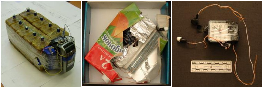
Рис.3 – внешний вид самодельных взрывных устройств

Скрытый пронос под одеждой и в ручной клади является самым распространенным способом доставки террористических средств к месту проведения террористической акции. Наиболее часто этот канал используется для доставки огнестрельного оружия. Огнестрельное оружие в собранном и разобранном виде имеет хорошо известные, достаточно специфичные и узнаваемые формы узлов, деталей и механизмов. Под одеждой и в ручной клади могут доставляться также взрывные устройства и радиоактивные вещества.