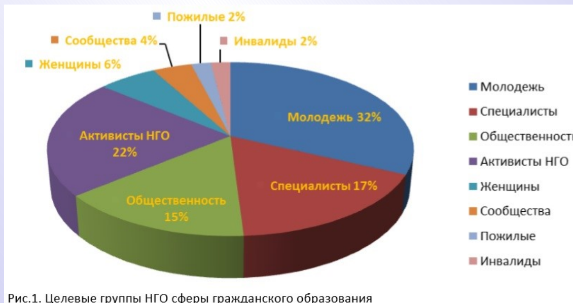
Рис.1. Целевые группы НГО сферы гражданского образования

На рисунке 1 показаны различные целевые группы, на которые ориентировано гражданское образование, предоставляемое НГО [2].