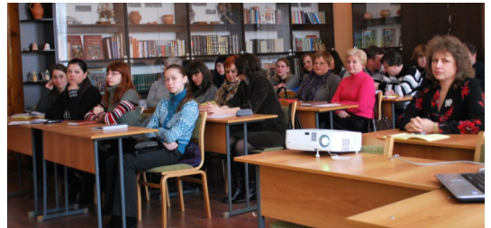
Міжфакультэцкая алімпіяда па рускай мове

Навукова-метадычны семінар «Праблемы выкладання рускай мовы як замежнага ў ВНУ»