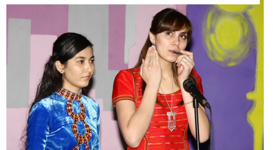
Урачыстае закрыццё Фэстываля