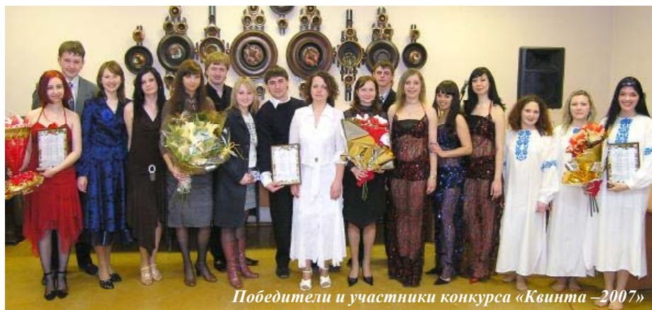
Победители и участники конкурса «Квинта – 2007»

30 марта в рамках фестиваля «Студенческая весна» прошел финальный тур конкурса вокалистов «Квинта – 2007».