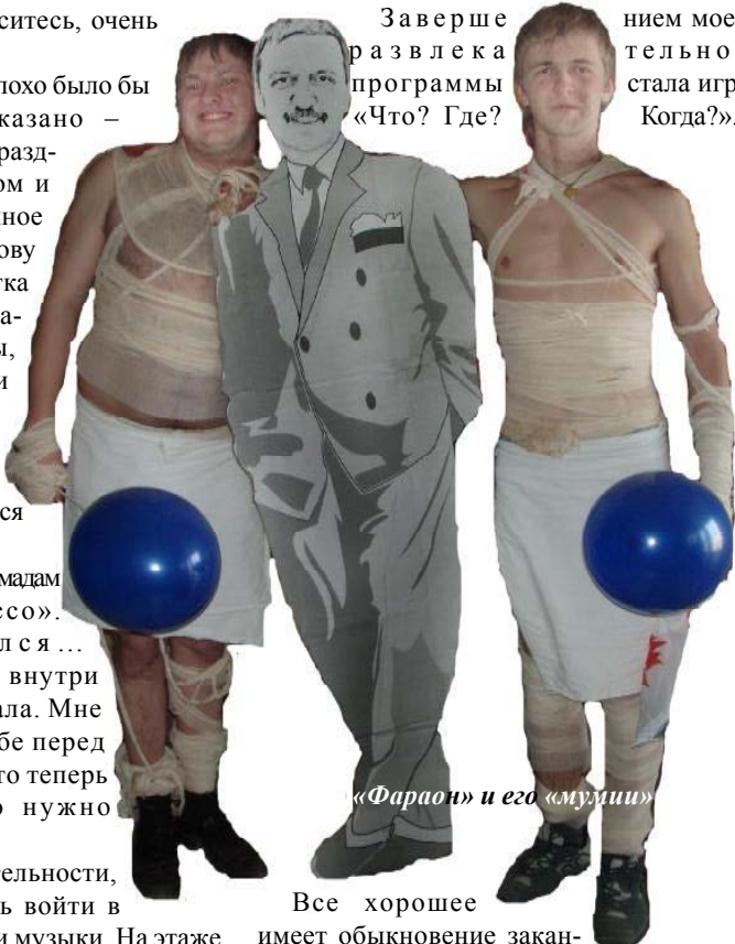
«Фараон» и его «мумии»

Завершением моей развлекательной программы стала игра «Что? Где? Когда?».