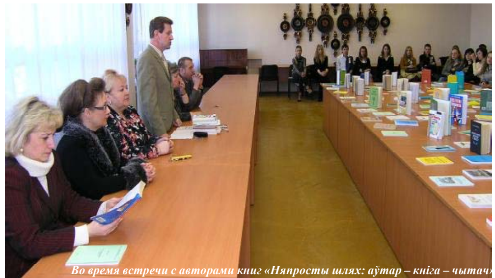
Во время встречи с авторами книг «Няпросты шлях: аўтар – кніга – чытач»

Ректорат, Совет ветеранов, профкомы сотрудников и студентов