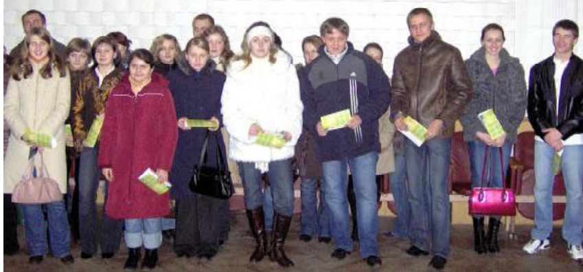
Участники акции «Твой первый выбор» на избирательном участке №19

14 января (а также во время досрочного голосования) свой голос за кандидатов в депутаты местных Советов отдали около 200 студентов-первокурсников нашего университета. Это были первые выборы в их жизни. Для этих ребят в университете 10 января стартовала акция «Твой первый выбор». Ее цель – поздравить голосующих с первым выбором, с первым участием в делах государства.