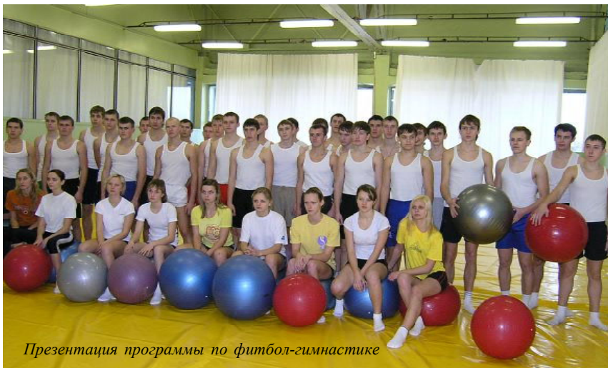
Презентация программы по фитбол-гимнастике

Стартовала республиканская акция «Здоровый я – здоровая страна!». Эта акция является долгосрочным проектом: она будет проходить с февраля 2007 г. по декабрь 2010 г. Акция инициирована Министерством образования Республики Беларусь, и в ней примут участие все учреждения образования.