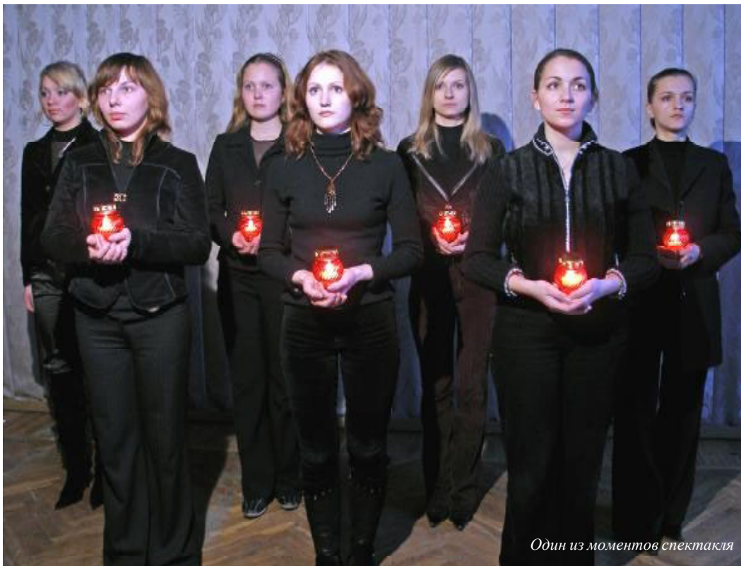
Один из моментов спектакля