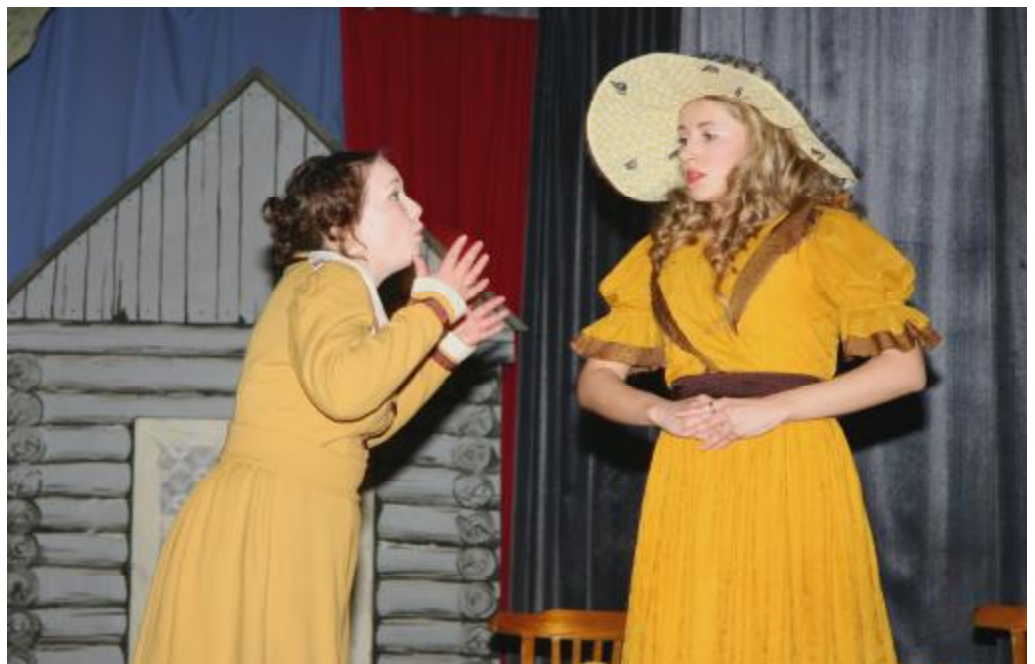
(Працяг на старонцы 4)

Поўны аншлаг спектакля яшчэ раз падкрэслівае, што класіка заўсёды ў павазе. Тым больш калі твор мае тэматыку і праблематыку, што ніколі не згубяць актуальнасць. А «Блаж», якая не карысталася папулярнасцю ў савецкі час, бо лічылася безыдэйнай, якраз да такіх твораў і адносіцца.