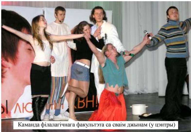
Каманда філалагічнага факультэта са сваім джынам (у цэнтры)

19 сакавіка ў ЦМТ адбылося ўрачыстае адкрыццё фестывалю студэнцкай творчасці «Студэнцкая вясна-2009». У гэты вечар прайшоў трэці тур універсітэцкай лігі КВЗ. Лідэрам па-ранейшаму застаецца каманда гістарычнага факультэта, з чым мы яе і віншваем.