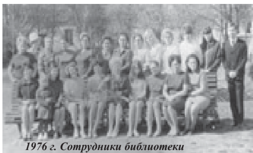
1976 г. Сотрудники библиотеки

60-летие отметила библиотека Брестского государственного университета им. А.С. Пушкина.