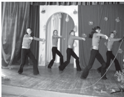
На фото: одним из мероприятий, приуроченных к 10-летию географического факультета, стал праздничный концерт.