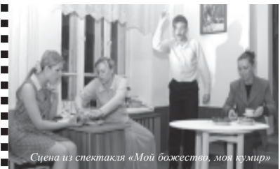
Сцена из спектакля «Мой божеество, мой кузир»