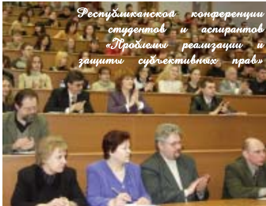
Республиканской конференции студентов и аспирантов «Проблемы реализации и защиты субъективных прав»

Юридический факультет был образован в 1996 году. Студенты, поступившие сюда, стали обучаться по специальности «Правоведение» со специализацией «Хозяйственное право». Первоначально была создана одна кафедра, затем две – уголовного и гражданского права