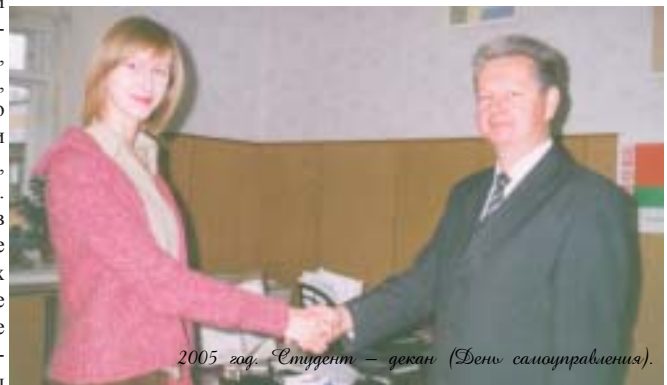
2005 год. Студент – декан (День самоуправления).

На факультете действуют две самые крупные по численности студенческие общественные организации: первичная