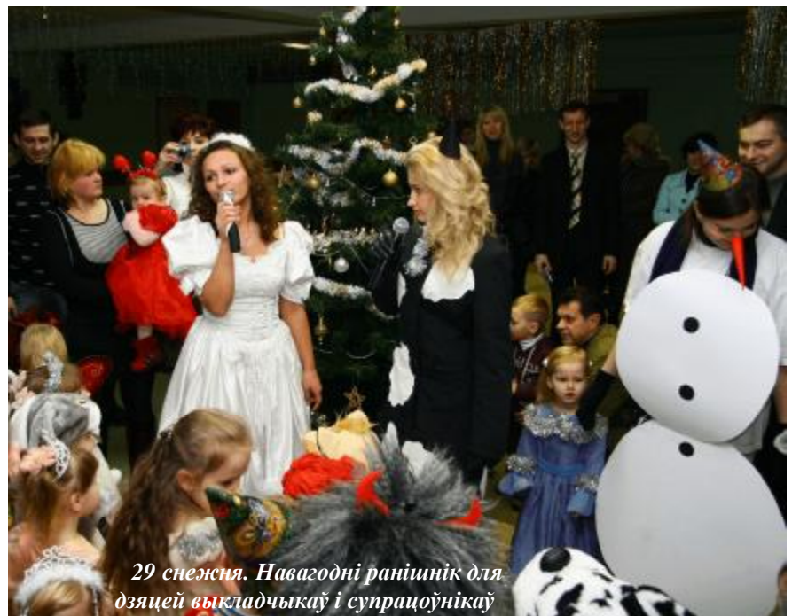
29 снежня. Навагодні ранішнік для дзяцей выкладчыкаў і супрацоўнікаў

2008 год быў для універсітэта чарговым годам развіцця. Я задаволены, што мы адкрылі шэраг новых спецыяльнасцяў, што за гэты час абаранілі доктарскія і кандыдацкія дысертацыі 8 нашых перспектыўных выкладчыкаў, што мы знайшлі аптымальную нішу для інавацыйнага развіцця універсітэта (гаворка ідзе найперш пра стварэнне філіялаў кафедр у роднасных навучальных установах).