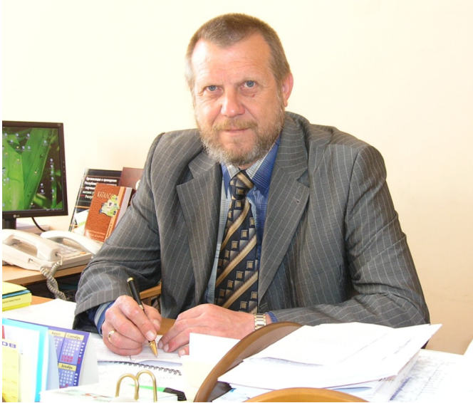
25 ноября прошёл Совет университета, на котором рассказать о SMK читателям.

рычагов повышения эффективности и конкурентоспособности промышленных предприятий и экономики в целом, в том числе и в области образования.