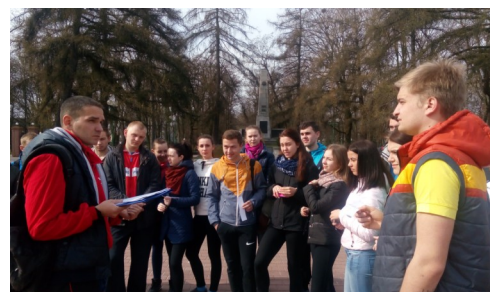
Квест-игра «И помнит Брест, войною опаленный», приуроченная 75-летию начала Великой Отечественной войны

:) Эти и другие новости Вы найдёте на сайте нашего университета www.brsu.by (: