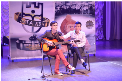
III тур университетской лиги КВН