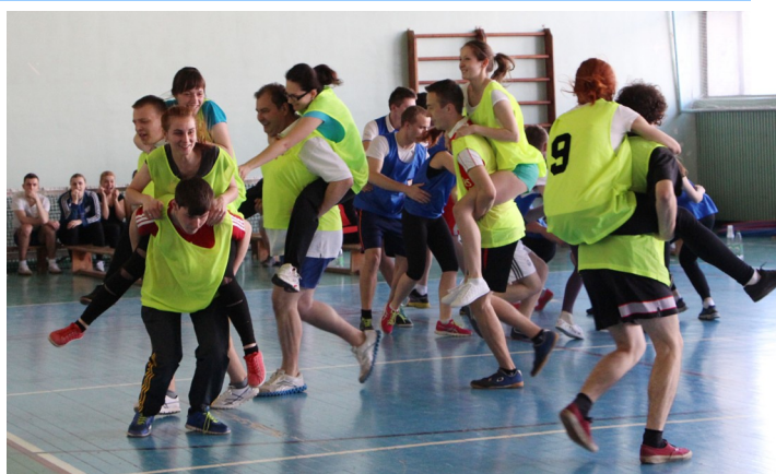
«Физкульт-УРА!» – спортивно-игровой праздник с участием преподавателей и студентов