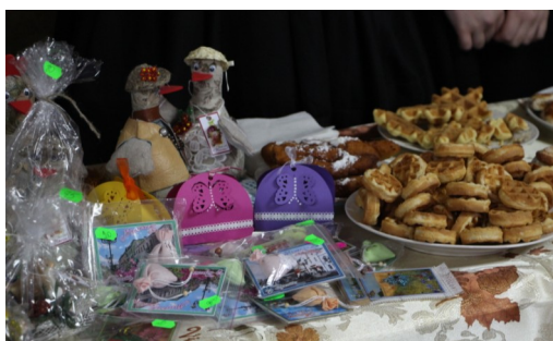
«Сделано со вкусом» – выставка-ярмарка кулинарной продукции, сделанной руками студентов