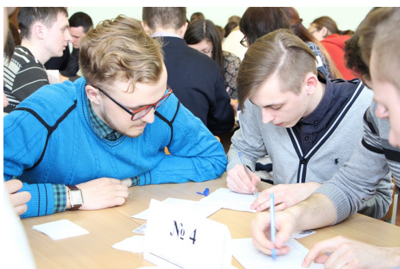
Университетский турнир по интеллектуальным играм среди факультетских команд