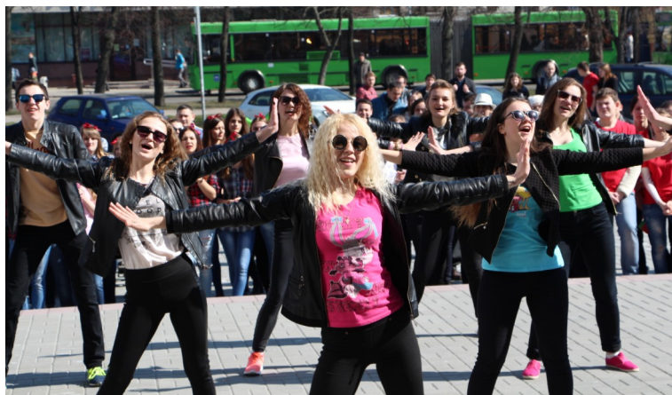
Флешмоб «Танцующий университет» в рамках открытия фестиваля студенческого творчества «Студенческая весна - 2016»

Вашему вниманию представляем лишь некоторые из многих ярких моментов в насыщенной палитре торжества.