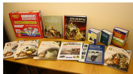
Выставка книг современных российских издательств на открытии Русского Центра

«Открытие Русского культурно-образовательного центра - важное событие в жизни филологического факультета. В Центре представлена выставка русских книг, которые могут быть важными и полезными для студентов. Безусловно, ценным является тесное сотрудничество фи-