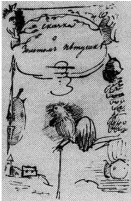
Титульный лист сказки о Золотом Петушке

Пушкин помимо громадного литературного наследия оставил человечеству огромное графическое наследие.