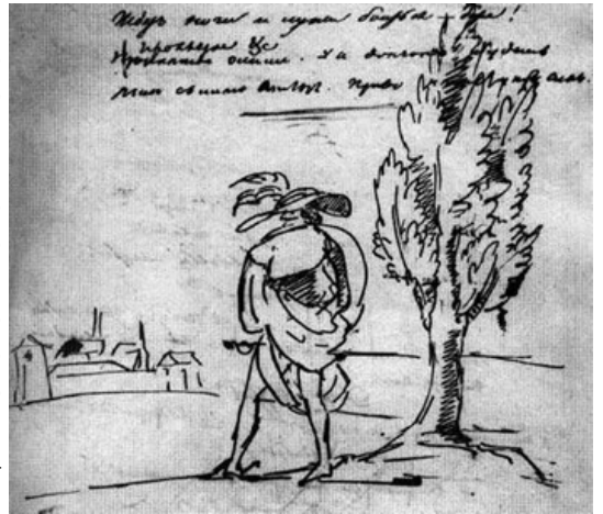
На холмах Грузии

Более нескольких тысяч рисунков, из которых приходится на портретные изображения и художественные наброски, сделано им на страницах набросков и черновых рукописей и лишь изредка на отдельных листах, в альбомах друзей, открытках и письмах. Он думал стихами, размышлял ими как поэт и вспоминал, анализировал, шутил и сердился рисунками и своими