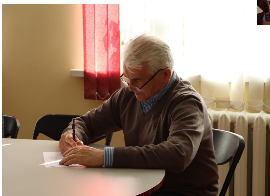
Самый взрослый участник

Участники, которые написали диктант на оценки «5» и «4», 15 апреля были награждены призами от Русского центра.