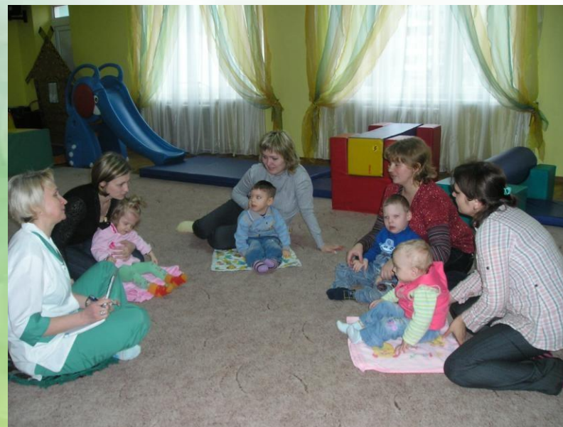
Работа с родителями в центре «Тонус»