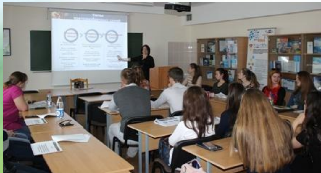
Семинар для студентов из Йошкар-олы по технологии сопровождения детей из повторнобрачных семей