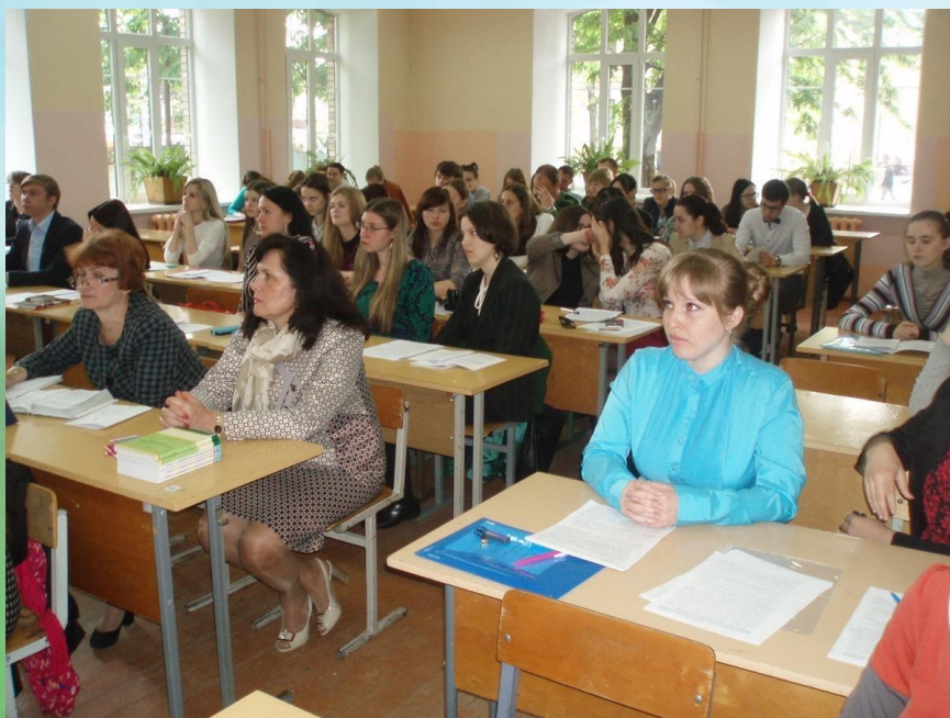
Студенческая конференция «Психология сегодня: взгляд современного студента»