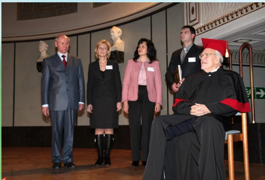
Конгресс, Мюнхен, 2009 г.