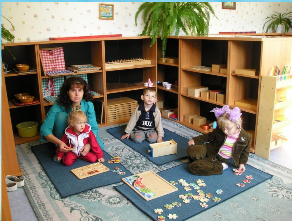
Педагогика Монтессори в действии, центр Тонус