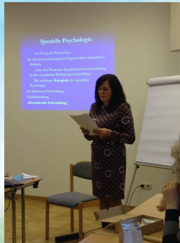
Международная конференция «Монтессори-педагогика и Монтессори лечебная педагогика» (Мюнхен, Германия).