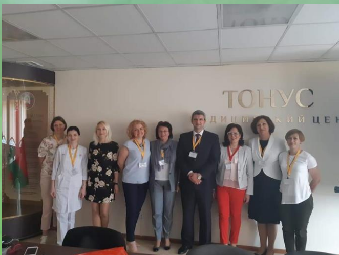
Конференция в Брестском областном Центре медицинской реабилитации детей с психо-неврологическими заболеваниями «Тонус»