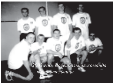
2003 год. Волейбольная команда – победительница