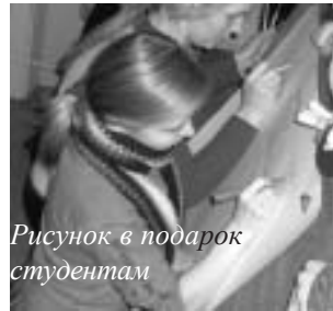
Рисунок в подарок студентам

За день-два, собранные студентами разных факультетов, мы подарили детям сладкие