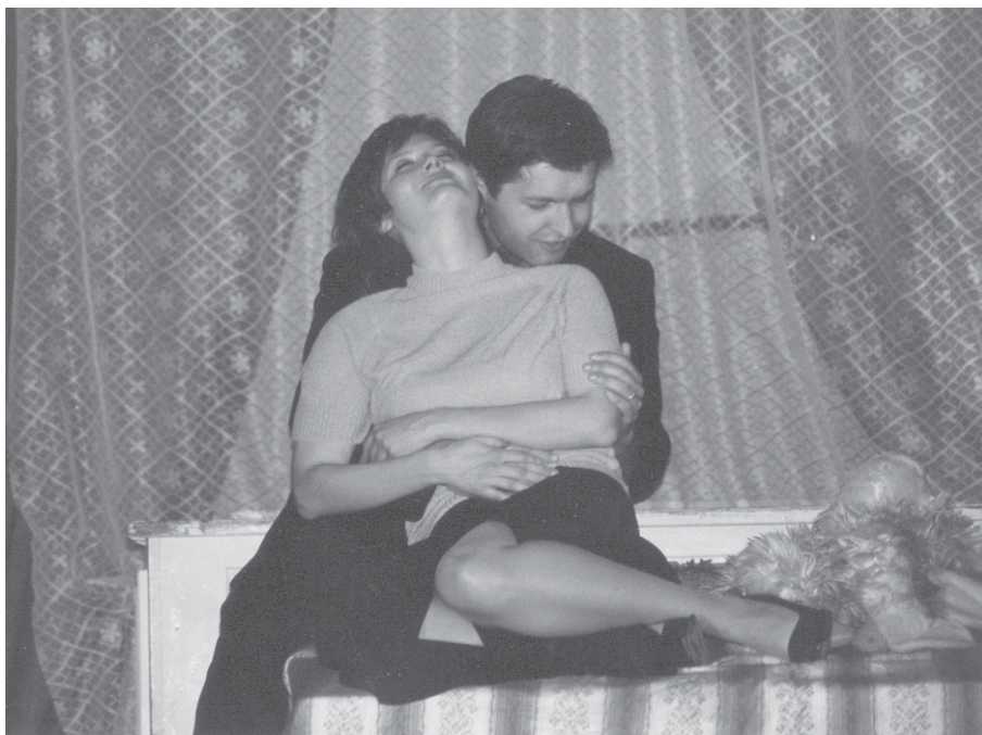
«Ким» – 2004

Более двух часов продолжается спектакль – и даже сидящая на приставных стульях публика не шелохнется. В очередной раз Павел Дмитриевич и его актеры покорили студенческие души.