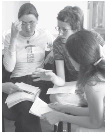
Будущие лидеры за учебой

мочь девушкам научиться разрешать подобные трудности.