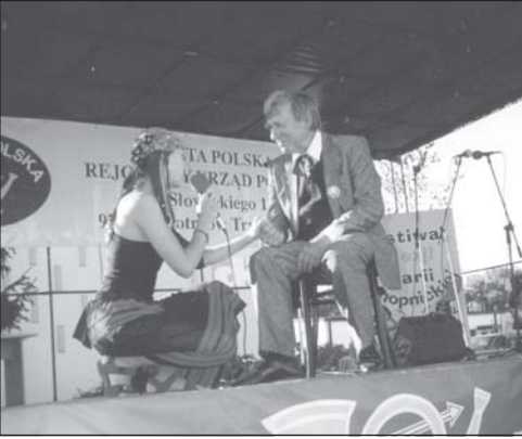
На сцене в Гурах Мокрых

Третий день фестиваля конкурса студенты посвятили поездке в Гуры Мокры, где посетили школу имени Марии