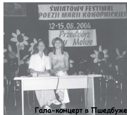
Гала-концерт в Пшедбуже

Конопницкой, побывали на Святой мессе в костеле, а после полудня организовали концерт для местных жителей. Даже сильный дождь не