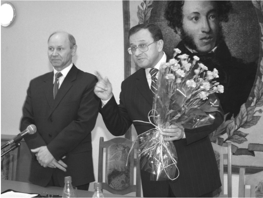
16 апреля. Председатель Брестского облисполкома Константин Сумар в нашем университете