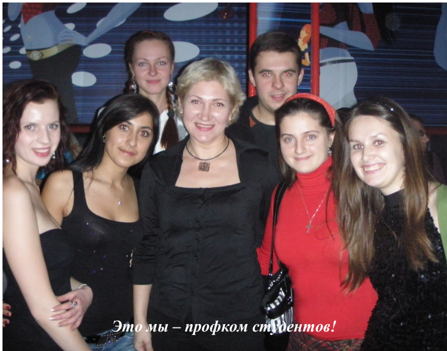
Это мы – профком студентов!

Внимание, студенты, проживающие в общежитиях университета!